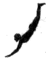
La lastra Il Tuffatore sarà al Museo Archeologico

« P ompei eternal emotion», il piccolo film girato da Pappi Corsicato per promuovere il sito archeologico vesuviano nel mondo, in concorso al New Media Festival di Los Angeles dove sarà proiettato il prossimo 7 giugno nella sezione cortometraggi d'autore che mette in palio per il vincitore un premio di 45mila dollari. Una partecipazione che riempie d'orgoglio Palazzo Santa Lucia che ha commissionato il video prodotto dalla Scabec, la società regionale per i beni culturali, con fondi POin. «Pappi Corsicato - ha dichiarato il Presidente della Regione Vincenzo De Luca - con la sua opera ci regala davvero un'eterna emozione da condividere con il mondo intero, affascinato e rapito dallo straordinario tesoro d'arte e storia rappresentato da Pompei. La partecipazione, in concorso, al Festival di Los Angeles, è motivo di orgoglio per la Campania e per il regista il giusto riconoscimento per un cortometraggio pieno di verità e suggestione. In bocca al lupo». «Doveva essere un video istituzionale destinato a valorizzare Pompei nelle sedi istituzionali adesso andrà anche in giro per i Festival di cinema»