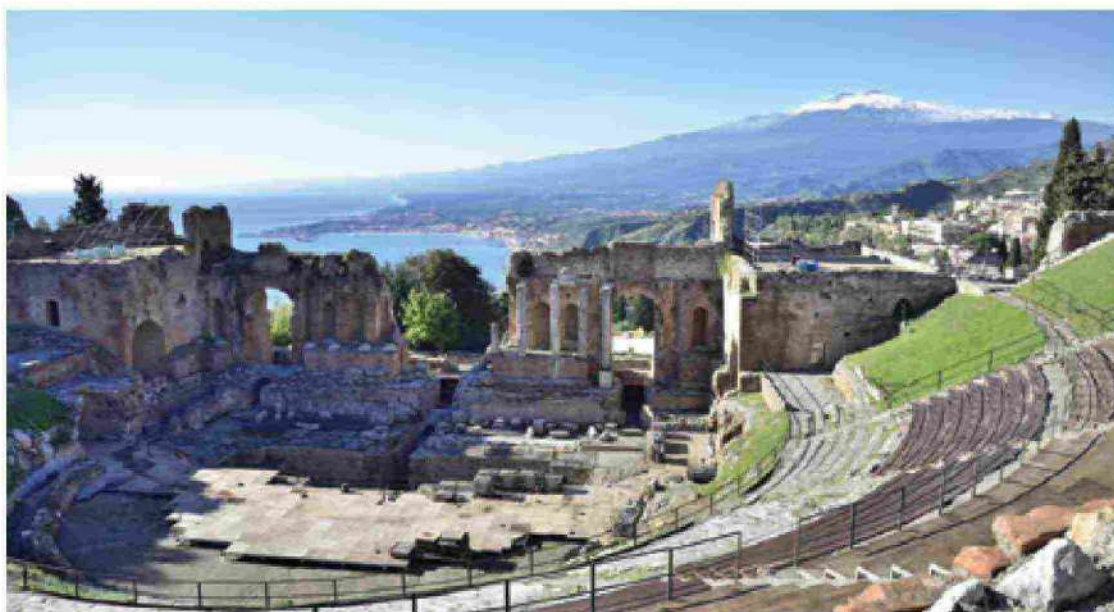
Teatro Antico di Taormina (ME)/Ancient Theatre of Taormina (Messina)