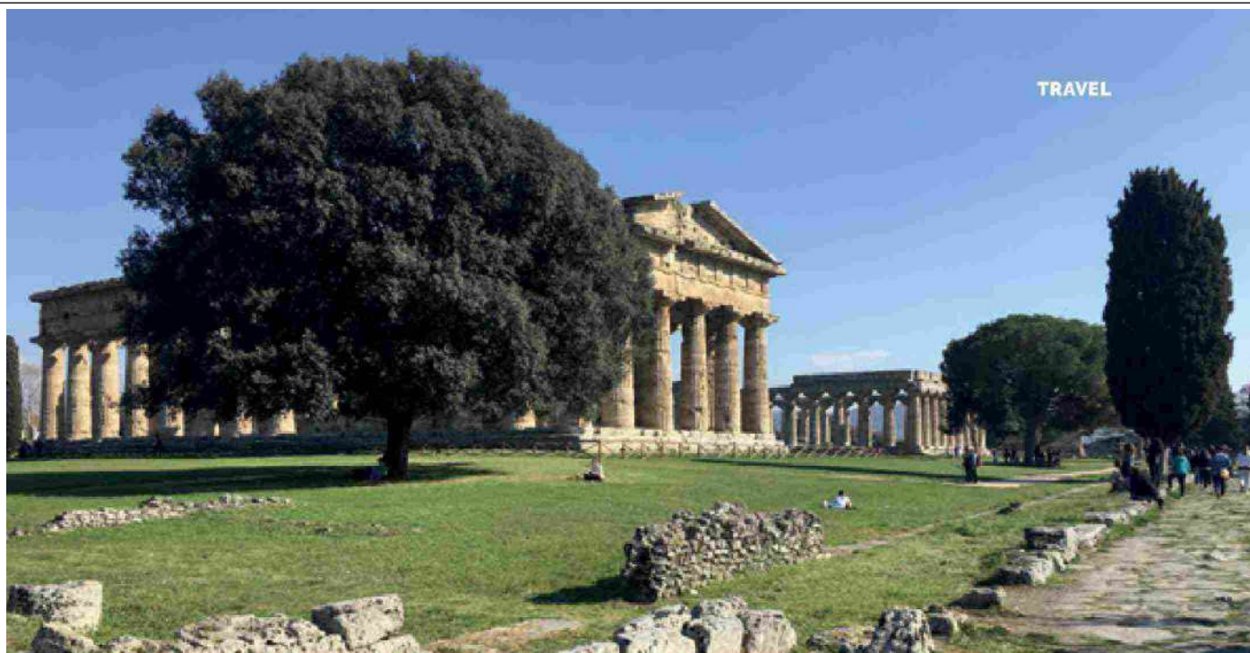
Basilica e Tempio di Nettuno. Paestum (SA)/Basilica and Temple of Neptune. Paestum (Salerno)