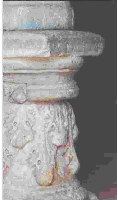
Bellezze paesaggistiche, storiche e architettoniche che contraddistinguono il territorio della Città metropolitana di Reggio Calabria

Ritaglio stampa ad uso esclusivo del destinatario, non riproducibile.