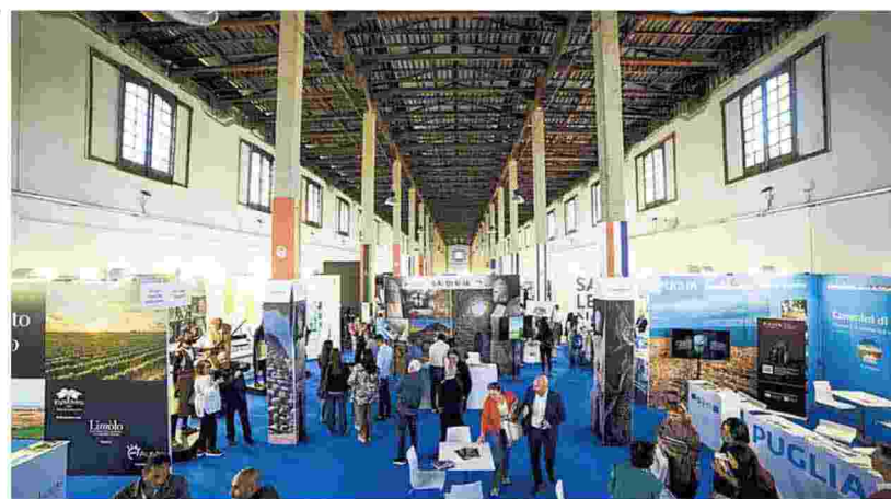
▲ Ex tabacchificio La sede della Borsa mediterranea del turismo archeologico