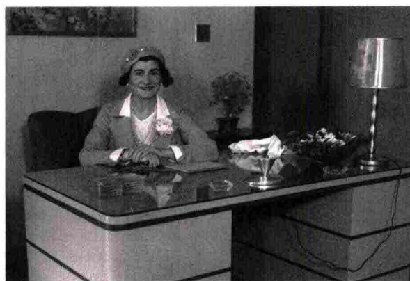
The Regents of the University of California

Quando fino al 25 febbraio 2024 / Info vam.ac.uk ◆◆