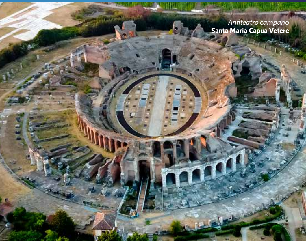
Anfiteatro campano Santa Maria Capua Vetere

La memoria diventa struttura. Ogni pietra misura l'eterno.