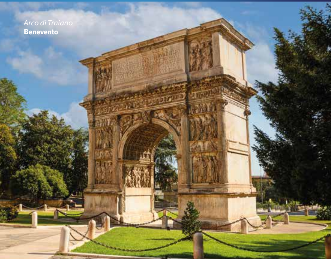
Arco di Traiano Benevento

Ogni pietra racconta un incantesimo. Un'emozione scolpita nel tempo.